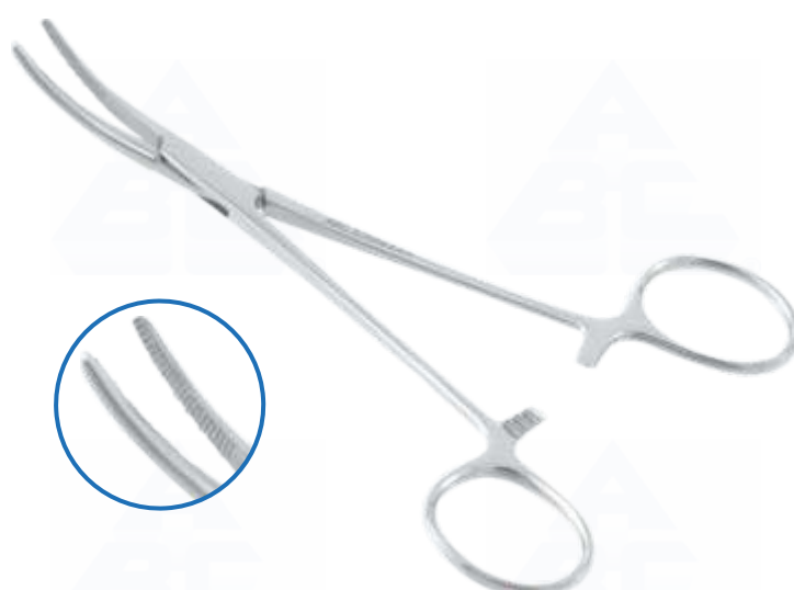
COD. 0232 - KELLY 14 cm CURVA (HEMOSTATICA) COD. 0234 - KELLY 16 cm CURVA (HEMOSTATICA) COD. 0377 - KELLY 18 cm CURVA (HEMOSTATICA)