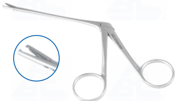
COD. 0229 - HARTMANN 9 cm P/ CORPO ESTRANHO C/ DENTE