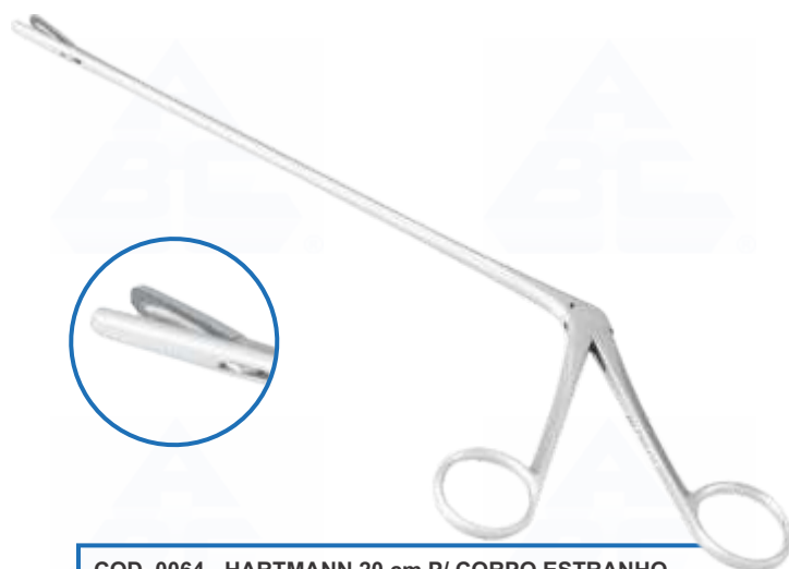
COD. 0064 - HARTMANN 20 cm P/ CORPO ESTRANHO C/ SERRILHA COD. 0065 - HARTMANN 28 cm P/ CORPO ESTRANHO C/ SERRILHA