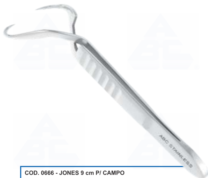
COD. 0666 - JONES 9 cm P/ CAMPO