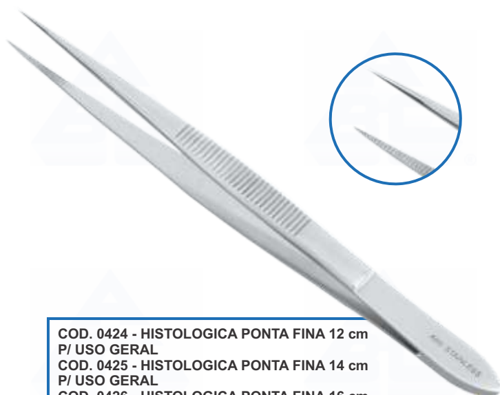
COD. 0424 - HISTOLOGICA PONTA FINA 12 cm P/ USO GERAL COD. 0425 - HISTOLOGICA PONTA FINA 14 cm P/ USO GERAL COD. 0426 - HISTOLOGICA PONTA FINA 16 cm P/ USO GERAL